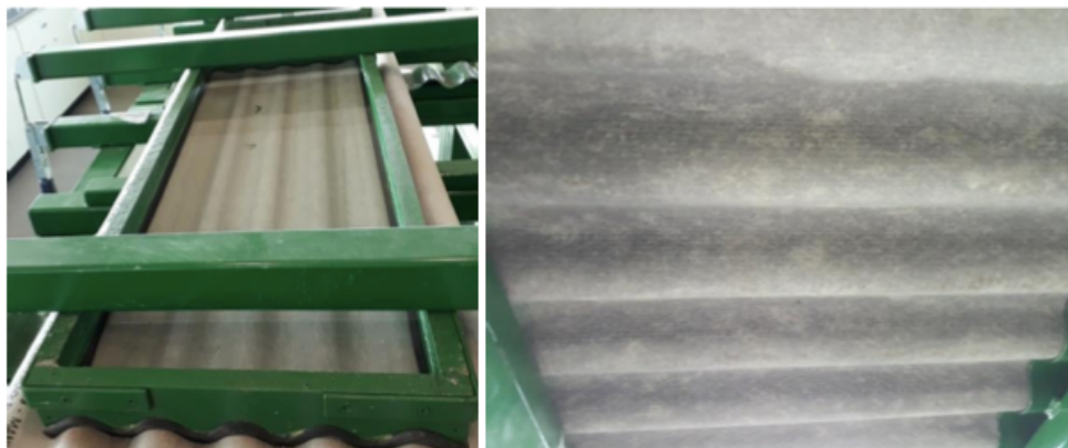
Figura 1. – Teste de permeabilidade, telha sem formação de gotas.

Amostras de lotes de telhas onduladas de 4 mm podem apresentar manchas escuras porém não devem transferir umidade da superfície inferior ao toque, para qualquer outra superfície seca ou apresentar formação de gotas/gotejamento.