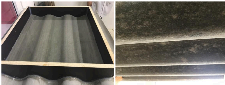
Figura 1. – Teste de permeabilidade, telha sem formação de gotas.