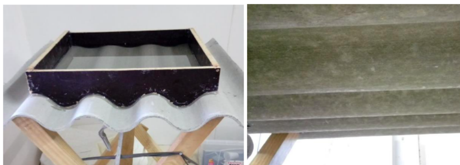
Figura 1. – Teste de permeabilidade, telha sem formação de gotas.

Amostras de lotes de telhas onduladas de 6 mm podem apresentar manchas escuras porém não devem transferir umidade da superfície inferior ao toque, para qualquer outra superfície seca ou apresentar formação de gotas/gotejamento.